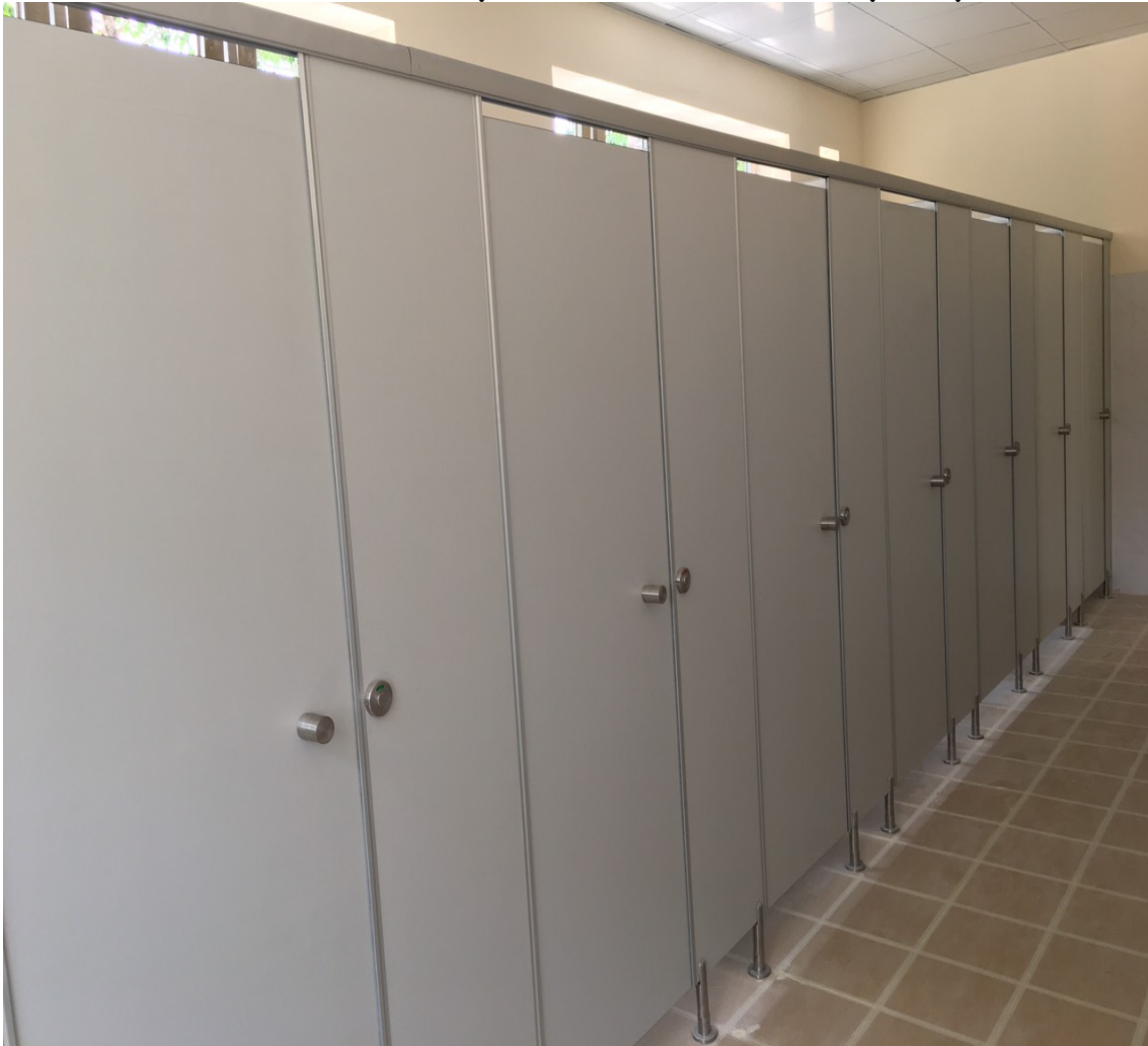
Hình ảnh vách ngăn vệ sinh tại công trình Trường Đại Học Văn Hiến năm 2021