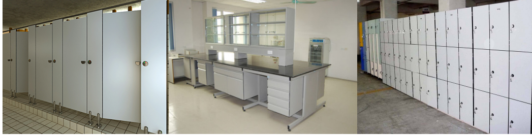
Vách vệ sinh