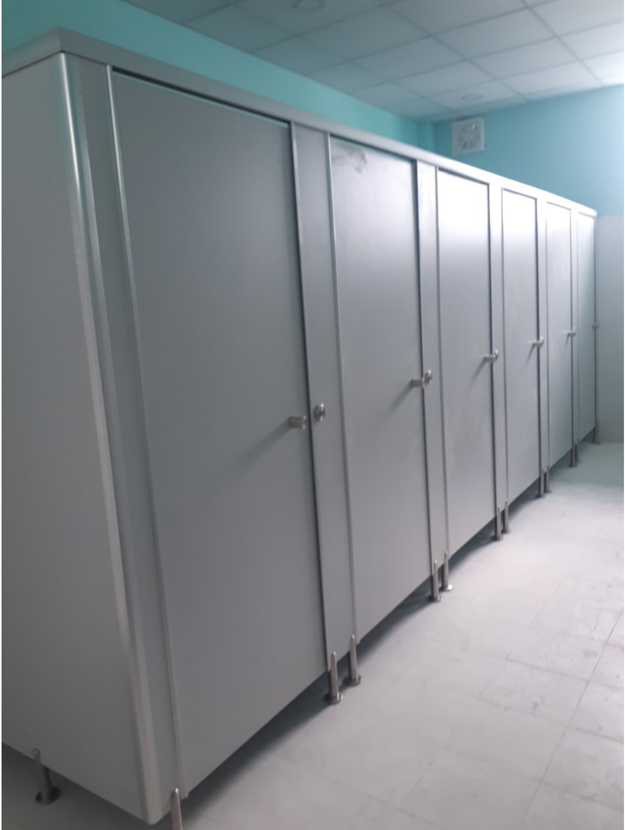
Hình ảnh vách ngăn vệ sinh tại công trình Nhà Máy Sản Xuất Tấm Thạch Cao VGSI tại KCN Phú Mỹ II mở rộng, Phú Mỹ, Bà Rịa – Vũng Tàu năm 2022