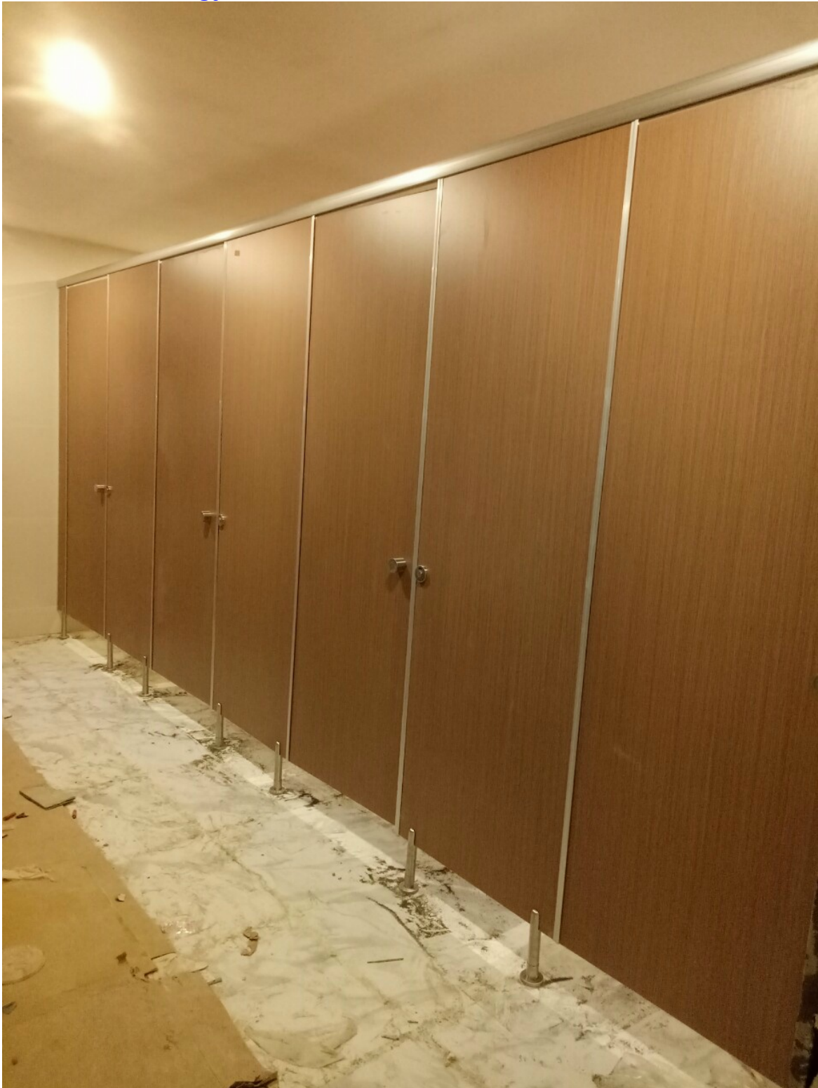
Hình ảnh vách ngăn vệ sinh tại Nhà máy Yichao Việt Nam giai đoạn 2– KCN Tân Đức, Đức Hòa, Long An năm 2023